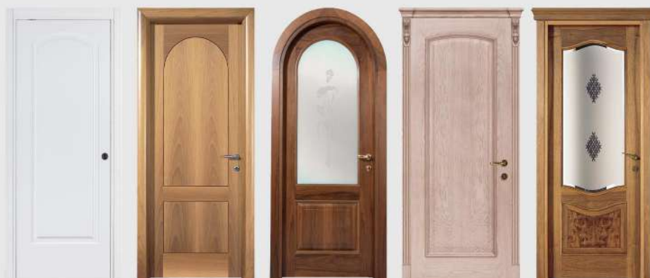
cod. Gemma cod. Giada cod. Giorgia cod. Greca cod. Incanto