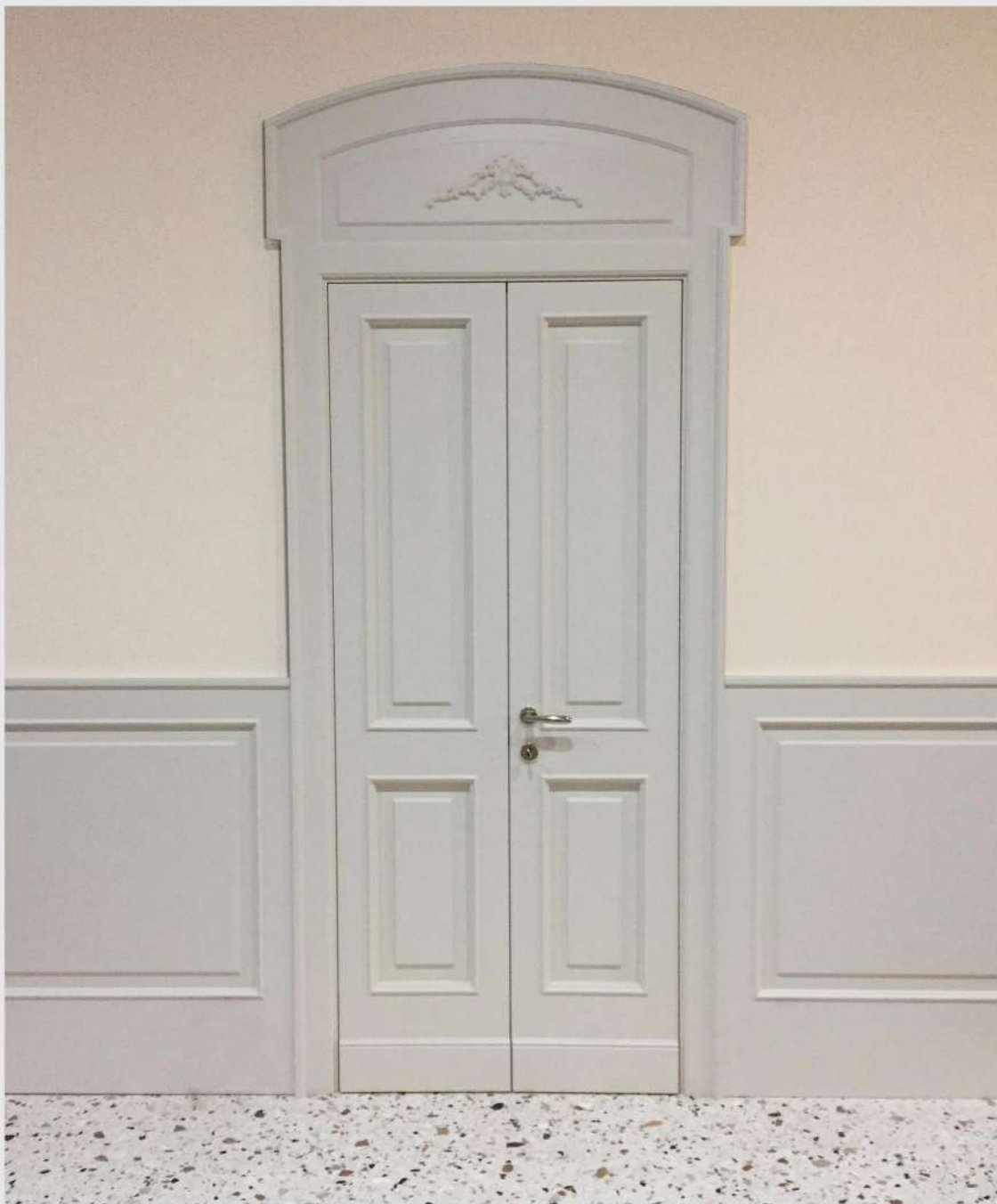
Modello: Sara Finitura: Laccato opaco