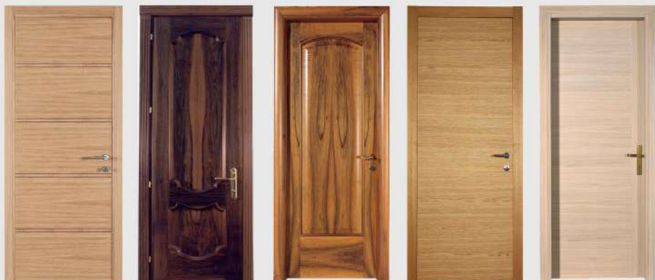
cod. Agata cod. Barocco cod. Carla cod. Chiara cod. Ciprea