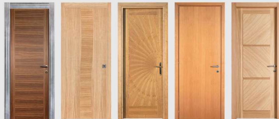
cod. Laura cod. Marea cod. Pavone cod. Pegaso cod. Pitagora