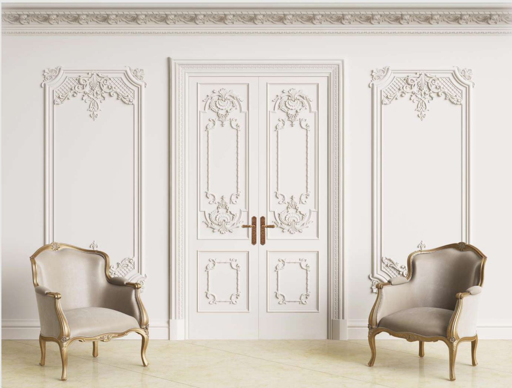
Modello: Giotto Finitura: Laccato opaco