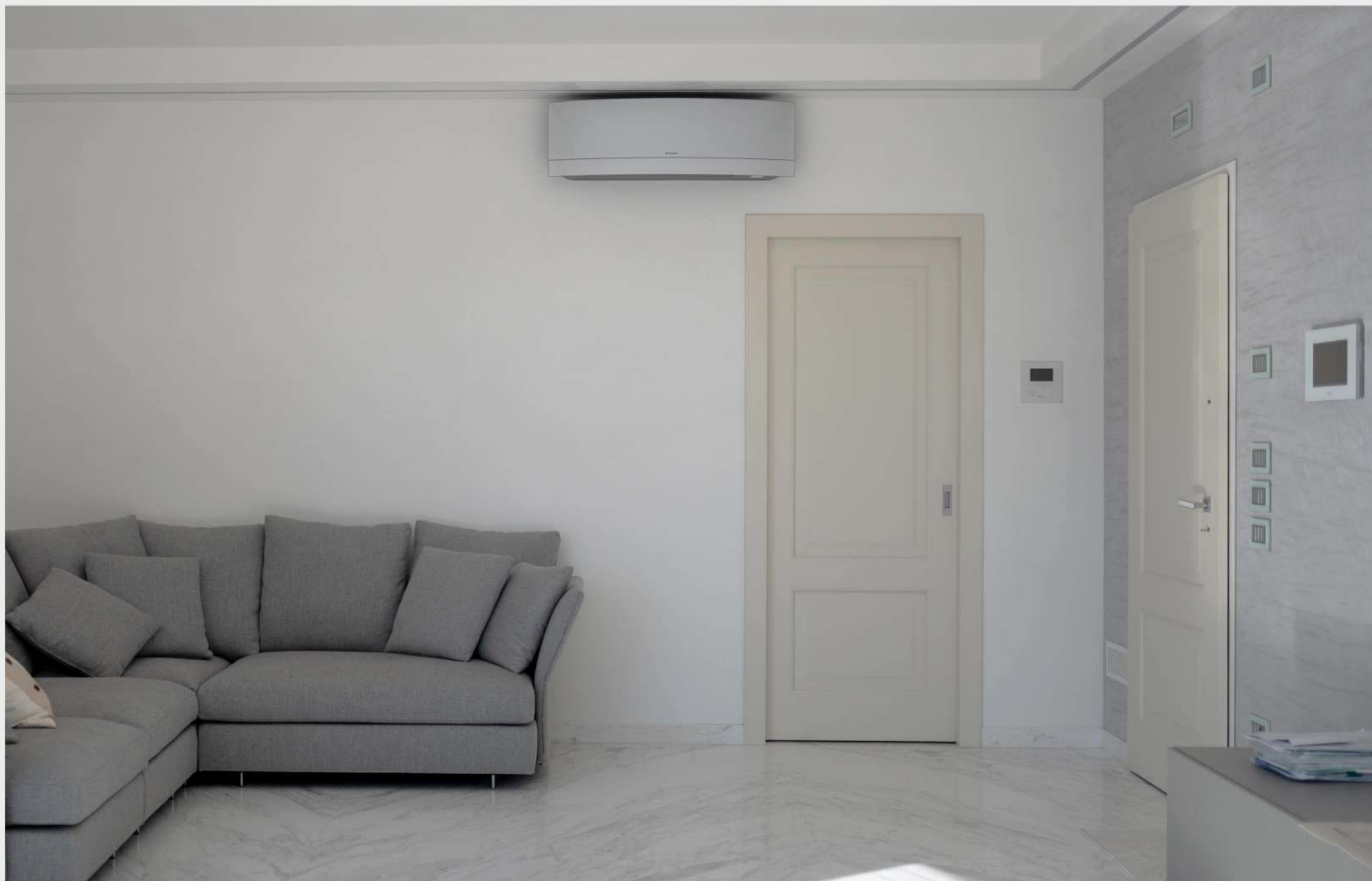
Modello: Sara Finitura: Laccato opaco