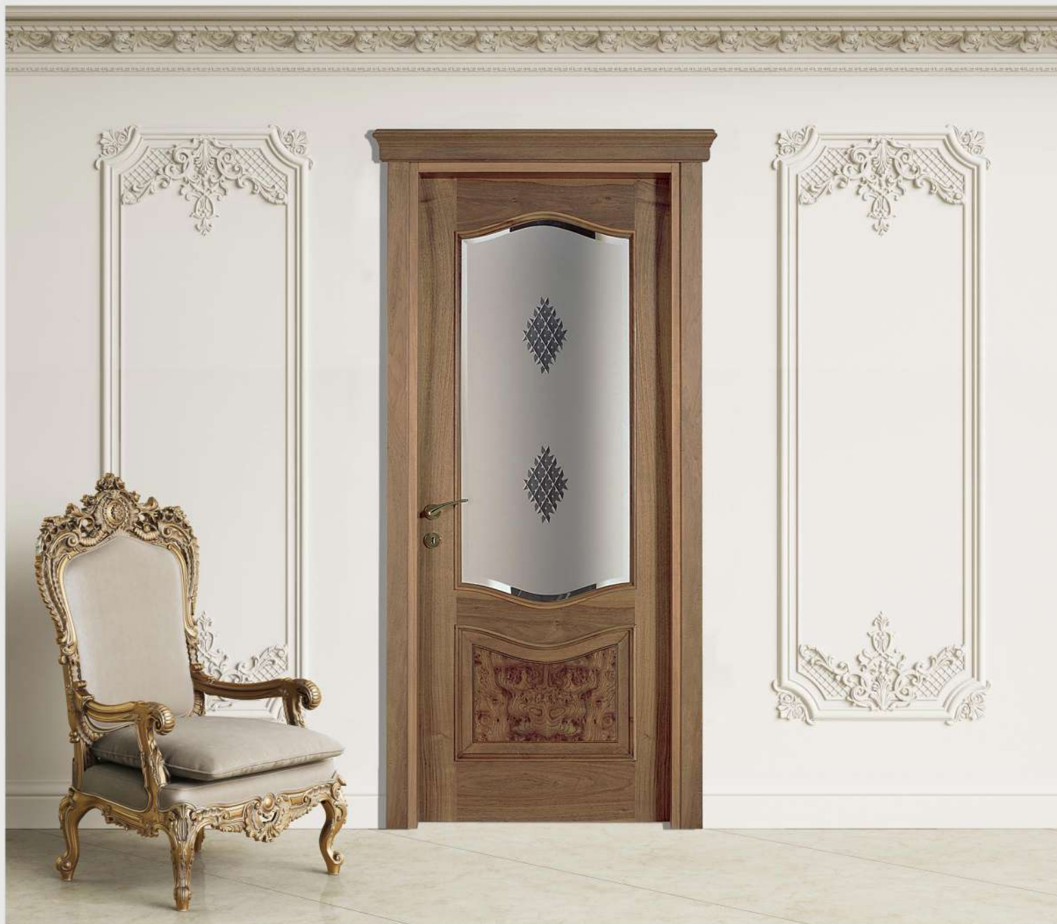
Modello: Incanto Finitura: Noce colore opaco