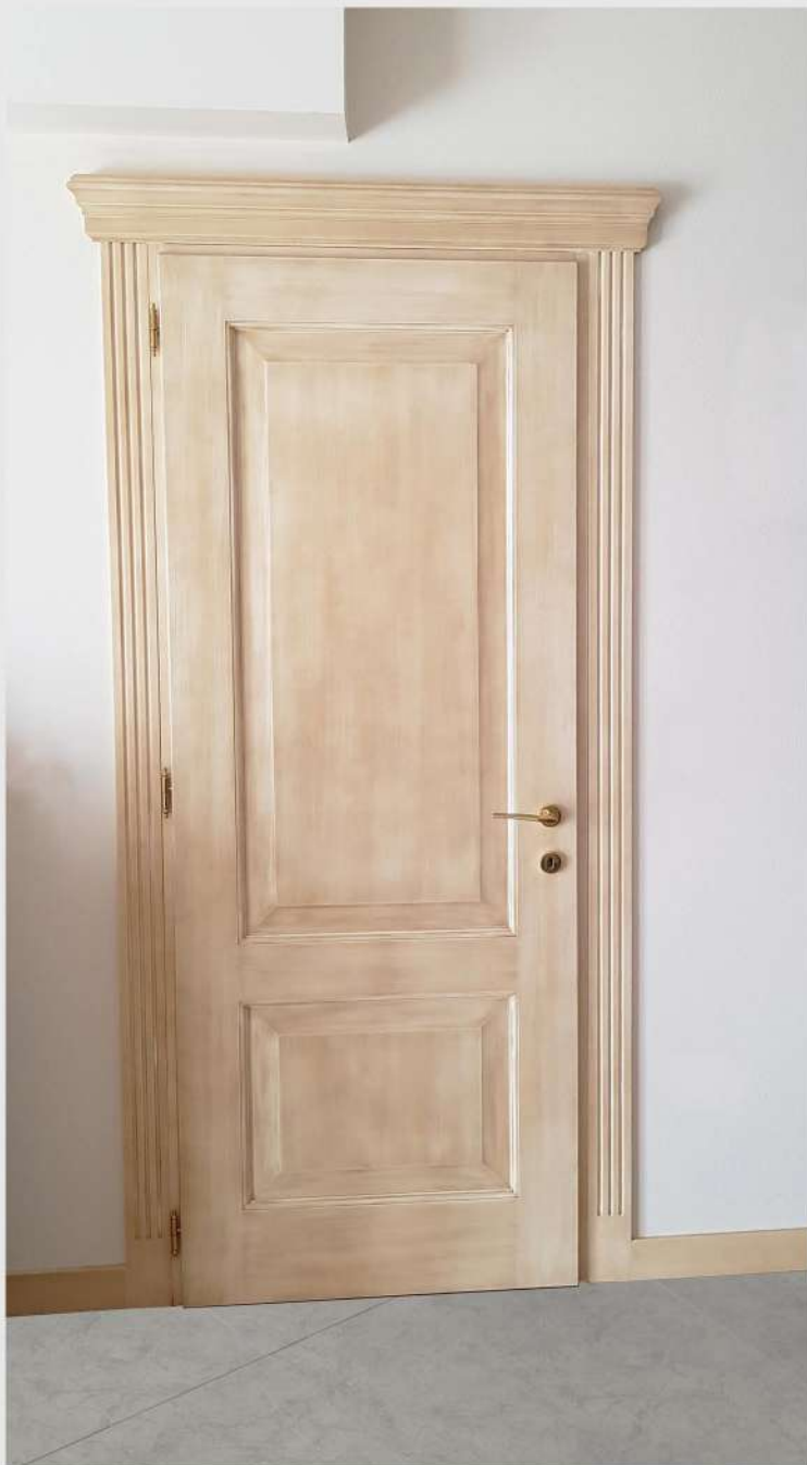
Modello: Sara Finitura: Laccato opaco patinato