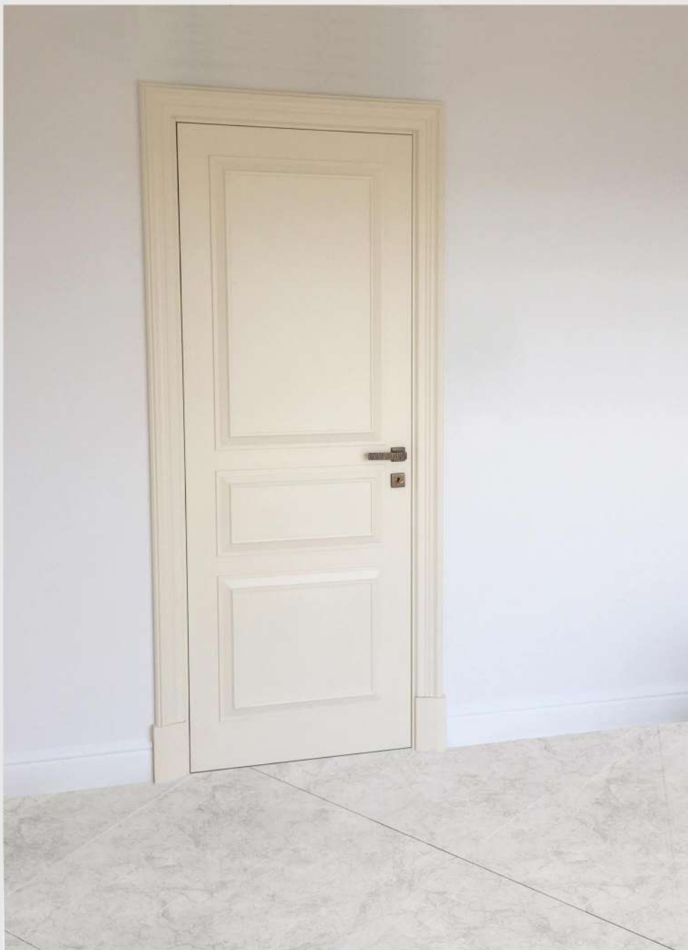
Modello: Custom Finitura: Laccato opaco pennellato