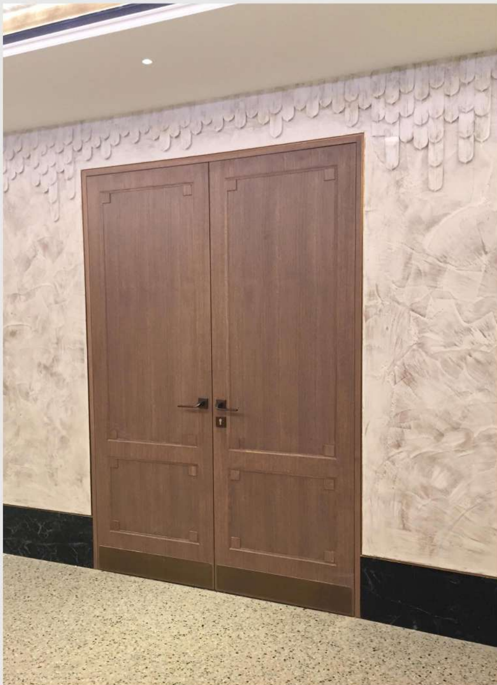
Modello: Custom Finitura: Rovere tinto a campione