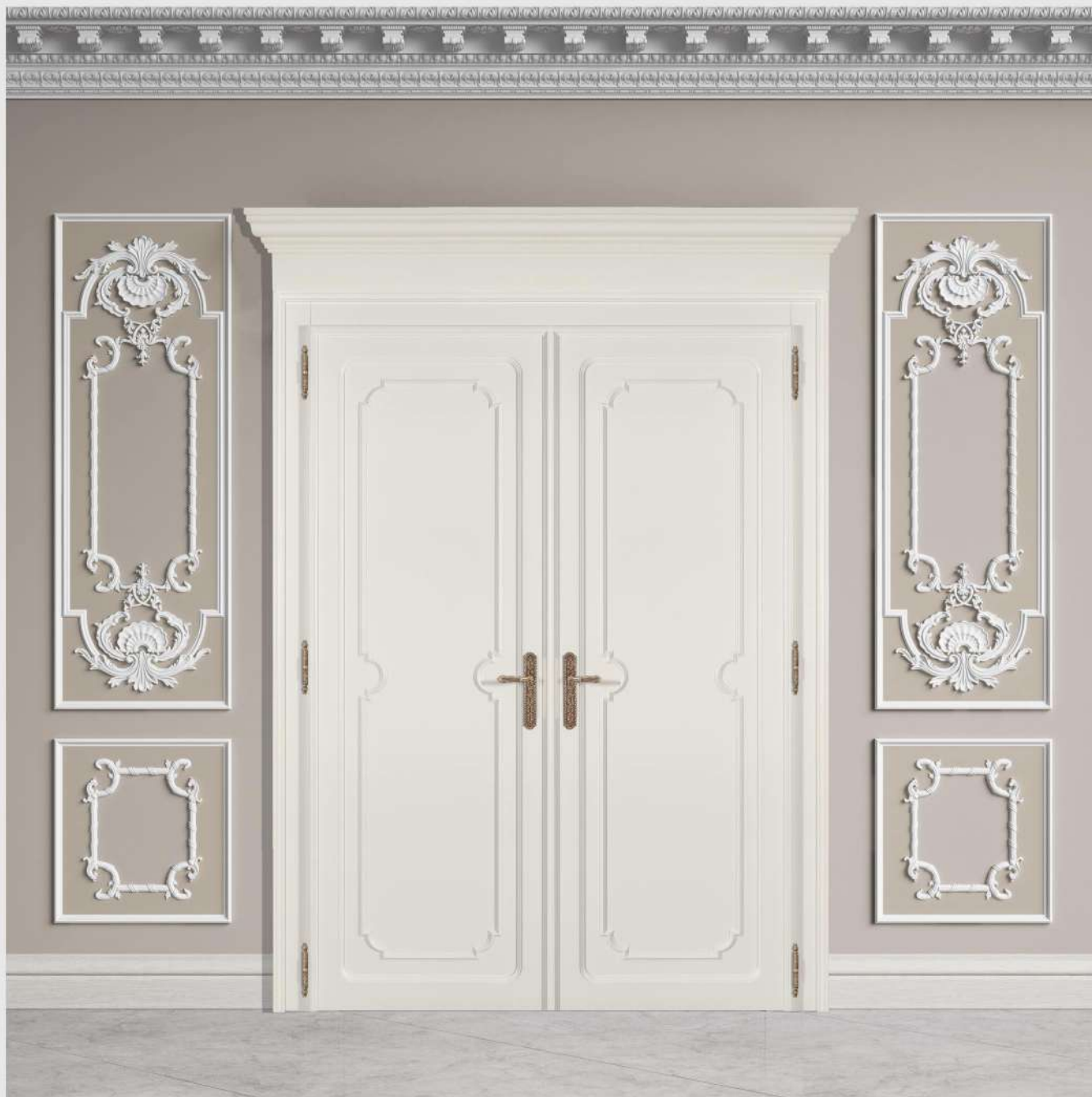
Modello: Vanity Finitura: Laccato opaco

Porte progettate e realizzate con la massima cura artigianale per creare dei prodotti unici per la tua abitazione.