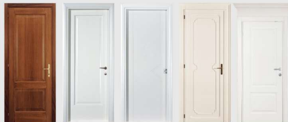
cod. Sara cod. Semplice cod. Sigma cod. Vanity cod. Zeus