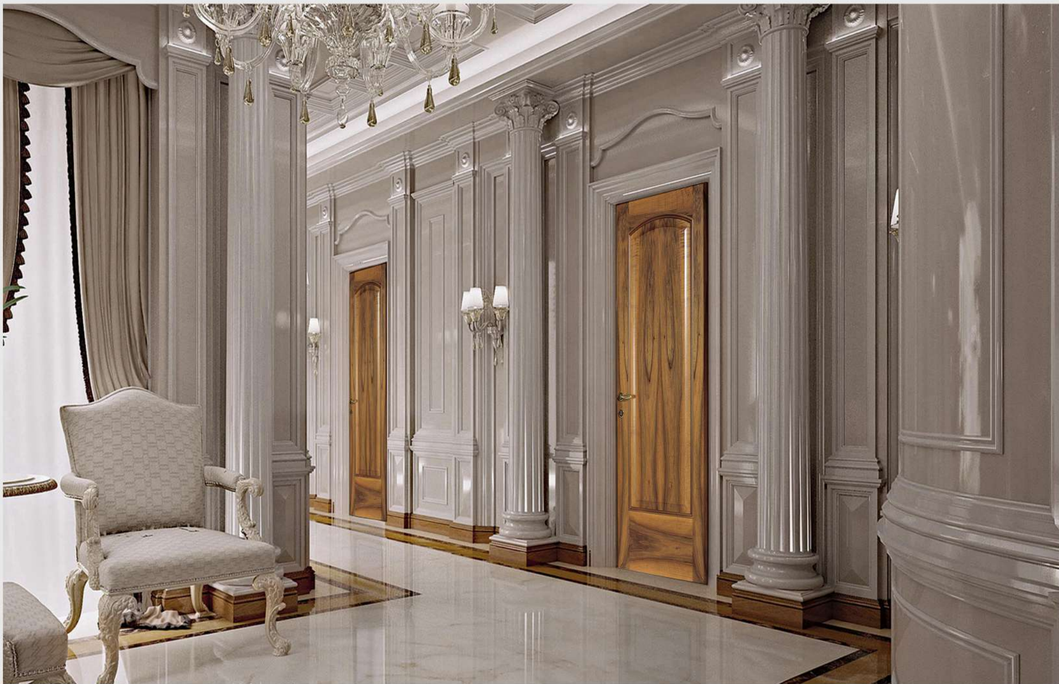
Modello: Carla Finitura: Noce colore opaco