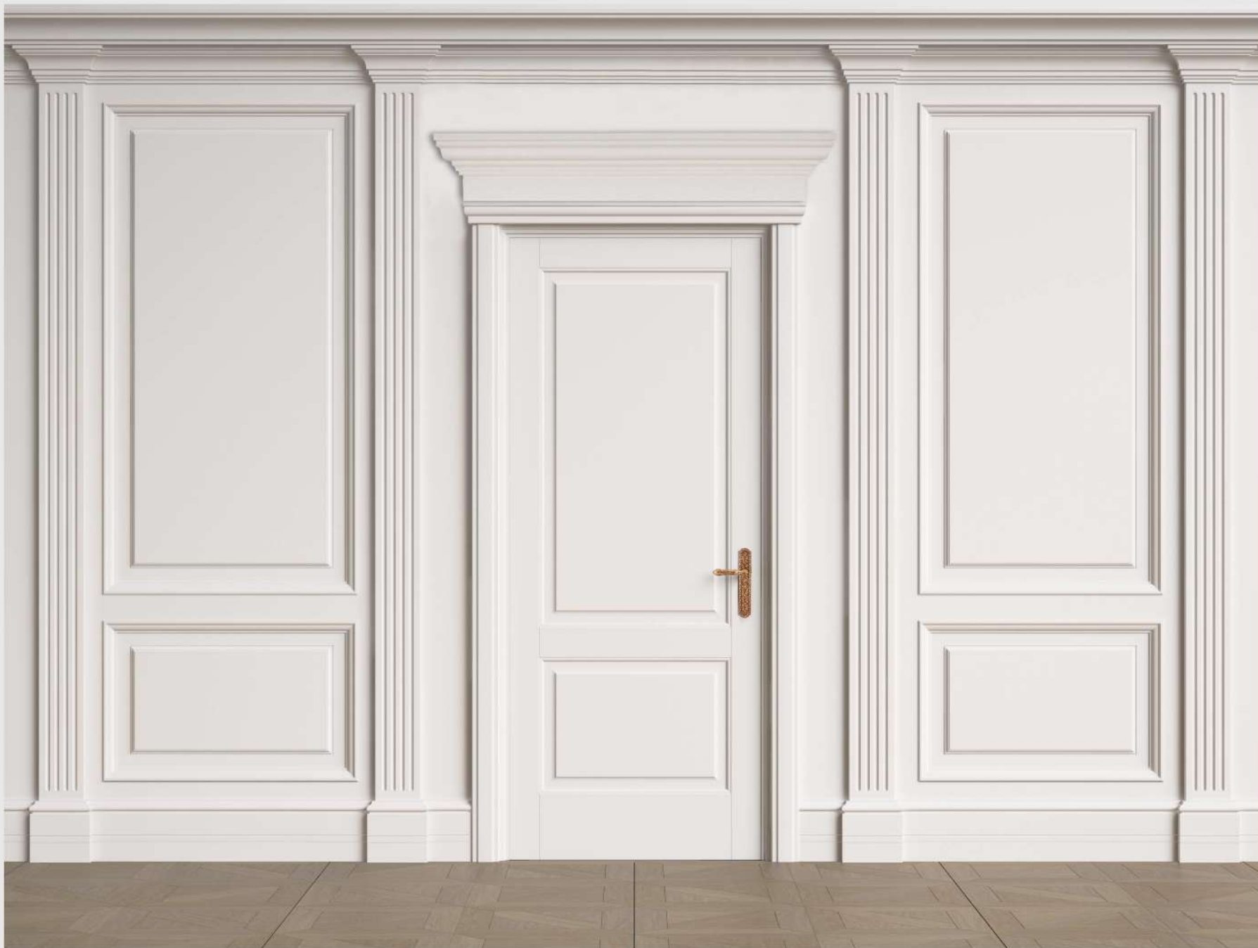
Modello: Zeus inciso Finitura: Laccato opaco