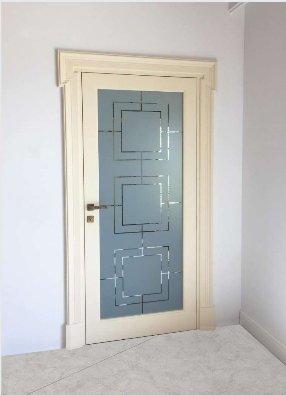
Modello: Custom Finitura: Laccato opaco pennellato