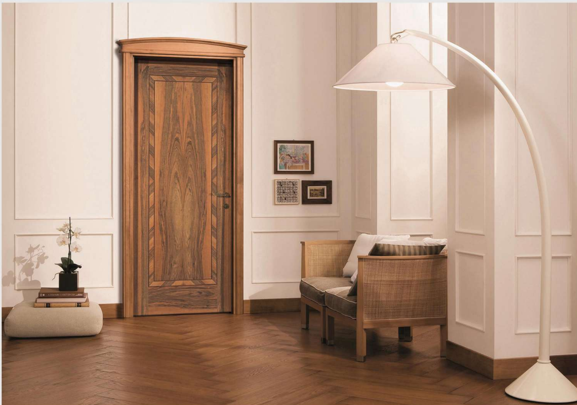
Modello: Doge Finitura: Noce colore opaco