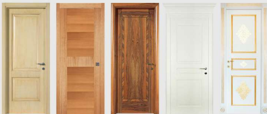
cod. Classica cod. Dafne cod. Doge cod. Elisa cod. Emanuela