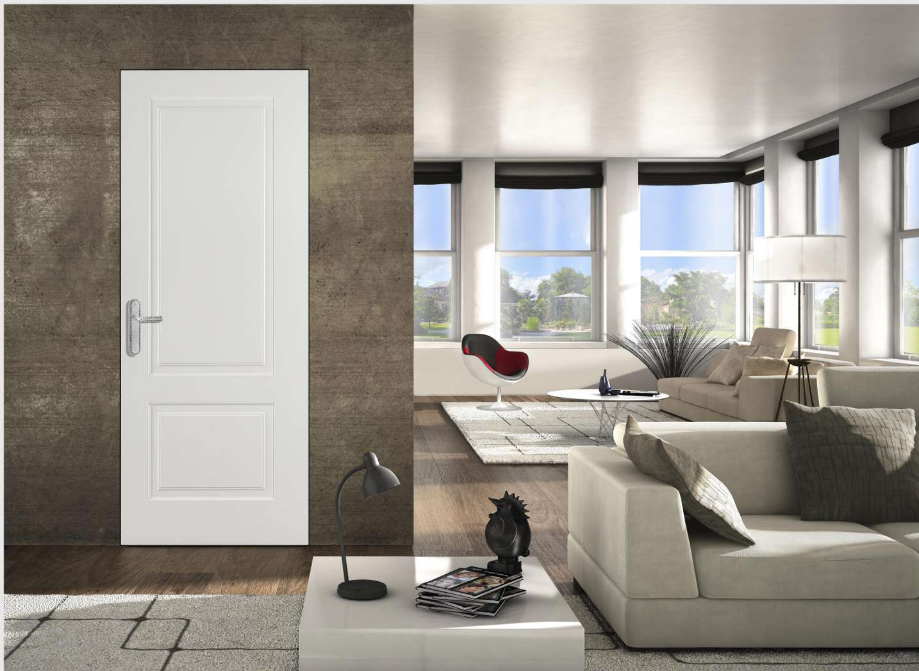
Modello: Zeus rasomuro Finitura: Laccato opaco