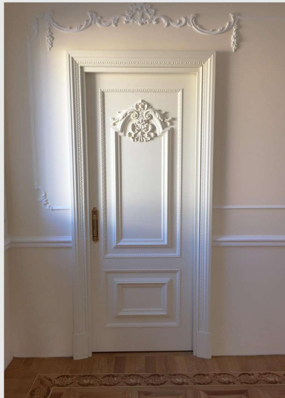
Modello: Michelangelo Finitura: Laccato opaco pennellato

Fascino classico. Intagli, fregi e modanature realizzate a mano.